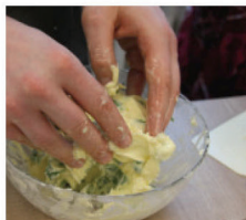
Wer gute Bärlauchbutter will, muss matschen!