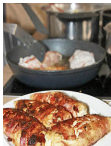
Hmm, wie das duftet: Gefüllte Hähnchenbrust wird in Speck gewickelt und gebraten.