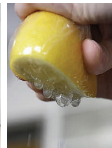
In Frischhaltefolie eingewickelt, in die ein paar Löcher gestochen werden, hält Zitrone lange frisch.

Arbeit sind wir fix und fertig – und unser Essen zum Glück auch. Unglaublich, wie lecker leichte Küche schmecken kann! Während wir genüsslich schmausen, denken wir kurz an Eva und den Apfel – und länger an Winston Churchill, der einst sagte: „Man soll dem Leib etwas Gutes bieten, damit die Seele Lust hat, darin zu wohnen.“