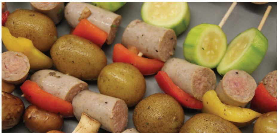
Pilze, Paprika, junge Kartoffeln in der Schale, Bratwurststücke und Zucchini ergeben zusammen würzige Räuberspieße, die man am besten in eine ratzfatz selbstgemachte Frühlingkräuter-Soße tunkt.